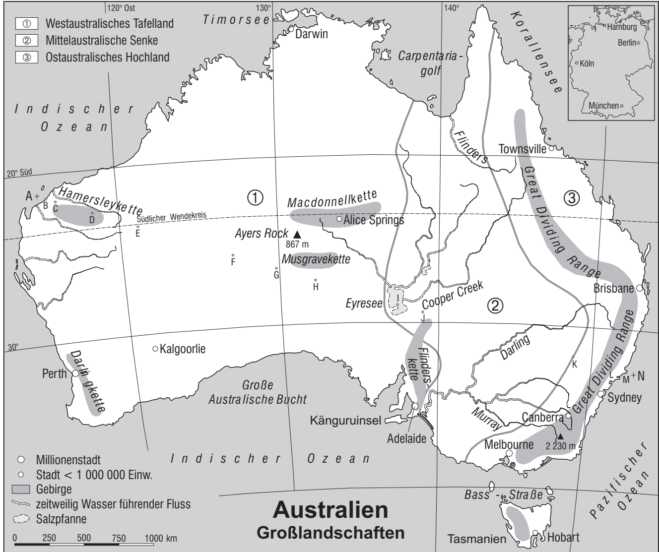
Höhenangaben der Profillinie in m über NN

Australien ist ein sehr alter Kontinent. Die Gesteine sind im Laufe vieler Jahrmillionen stark verwittert und abgetragen worden. Nur an wenigen Stellen haben härtere Gesteine dem Verwitterungsprozess standgehalten, wie in der Macdonnellkette oder dem berühmten Ayers Rock in Zentralaustralien.